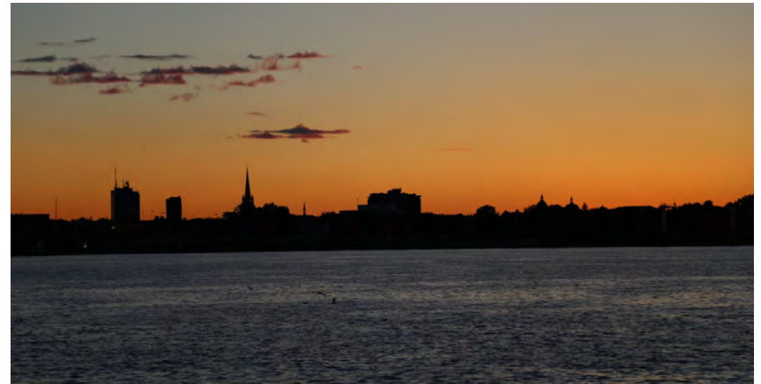
Figure 5. Centre-ville de Trois-Rivières