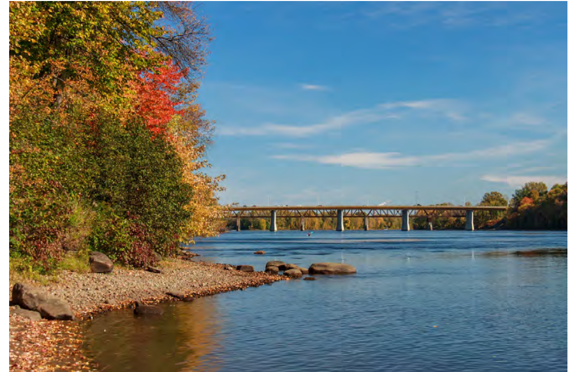
Figure 6. Rivière Saint-Maurice

57. La rivière Saint-Maurice comporte plusieurs aspects intéressants. Elle est un symbole identitaire important de Trois-Rivières et de la Mauricie en plus d'être très prisée pour les loisirs nautiques. De plus, elle a une importance clé en matière d'approvisionnement en eau potable, puisque l'usine de filtration alimentant les secteurs de Trois-Rivières, Trois-Rivières-Ouest et Pointe-du-Lac s'y approvisionne. Par ailleurs, ce grand cours d'eau a une importance particulière quant à la biodiversité, puisqu'on y retrouve des frayères et une grande diversité d'espèces de poissons.